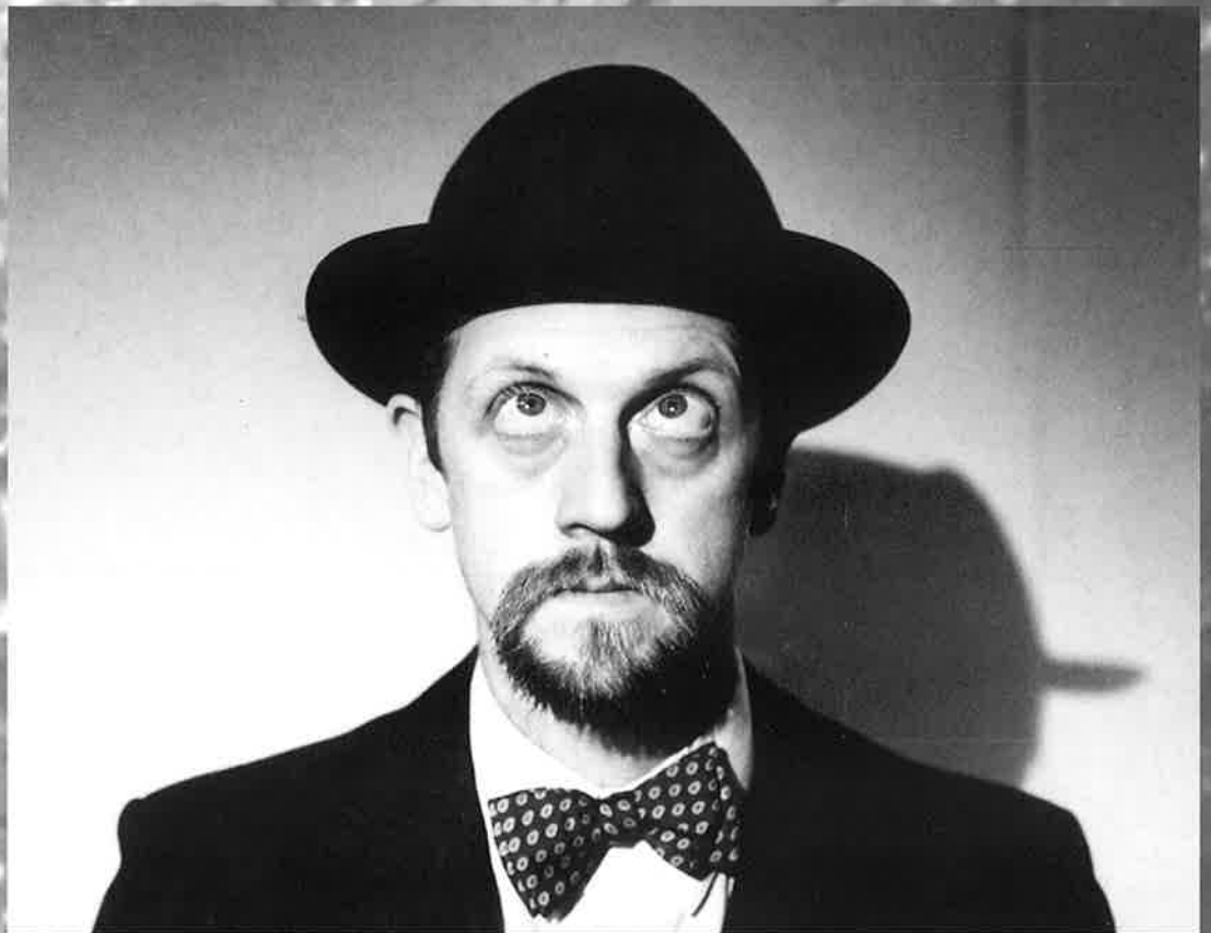
FRA «ALGOT STORM».