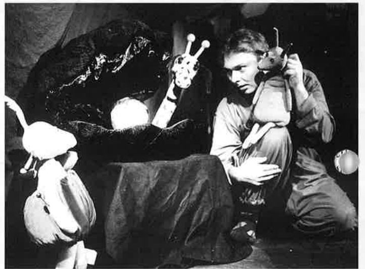
FRA «DEN VILLE ONGEN».